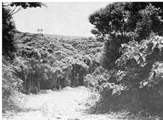
ツマグロアメイロの多かったアカメガシワ (右側の低い木) (沖縄本島辺土名)

1977年の例では、まず葉の表に飛来し、次に葉裏にまわって先端部まで進み、そこで静止していたが、1976年