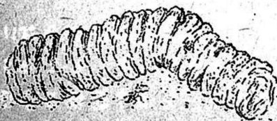
(銅貨を列べた様な糞)