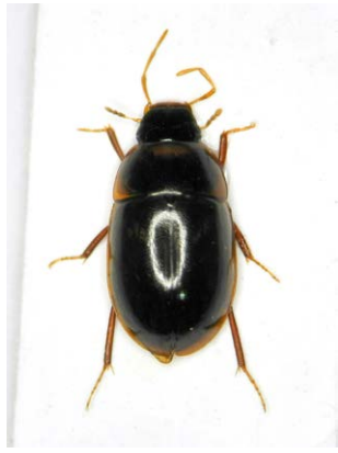
図1. 三重県産ニセコクロヒラタガムシ。

1♂2♀♀, 三重県志摩市大王町船越 船越池, 1. XI. 2012, 佐野採集・保管; 10exs., 同所, 26. VIII. 2013, 北野採集・保管; 20exs., 同所, 15. VIII. 2016, 渡部採集・保管 (うち 5exs. は蓑島悠介博士保管) (図 1)。