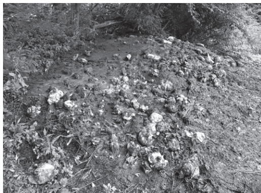
図2. ニセヒメエンマムシの生息環境。