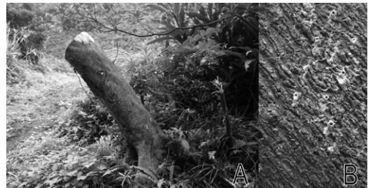
図2. A, 畑の縁のホルトノキの切り株; B, ホルトノキの樹皮上に開いた穿孔 (青ヶ島村)。